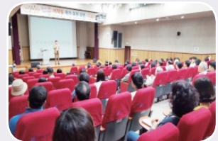
김 금 선 (하브루타 부모교육연구소장) 저서: 『생각의 근육 하브루타』 『하브루타로 크는 아이들』