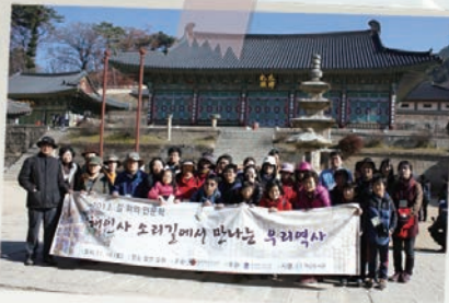
- 길 위의 인문학(해인사소리길 탐방) -