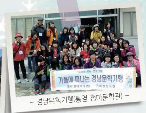
- 경남문학기행(통영 청마문학관) -

단풍이 색색이 옷을 갈아 입는 가을의 끝자락 11월 마산도서관에서는 인문학특강(조운범), 길 위의 인문학, 경남문학기행 등 다양한 강연과 탐방행사가 운영되었습니다. 참여해주신 여러분 감사드립니다.