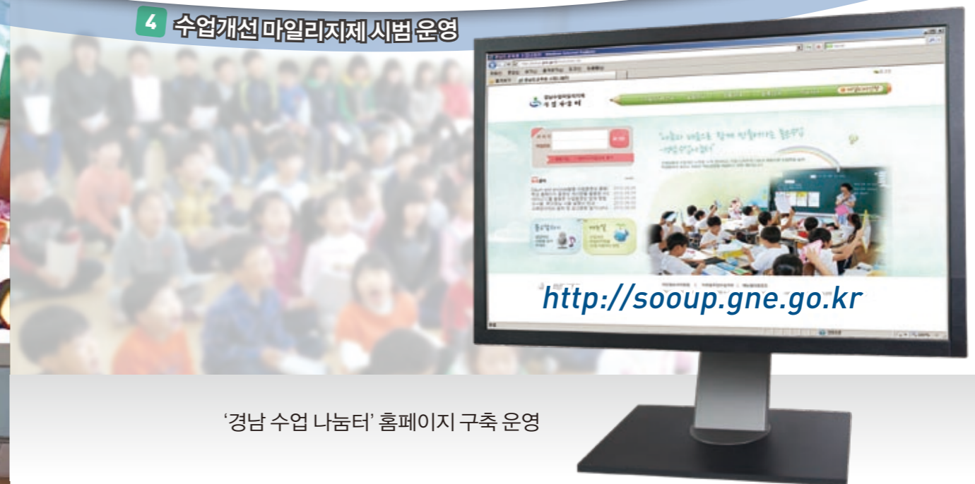
'경남 수업 나눔터' 홈페이지 구축 운영