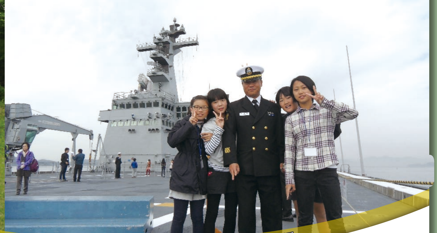
2 통일·안보교육 강화