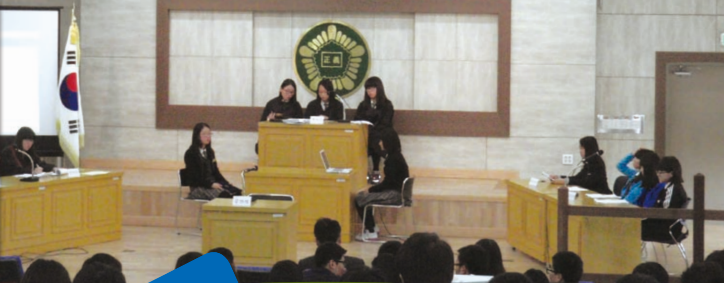
1 학생자치활동 활성화

특별 없는 행복한 학교 만들기를 위한 소통과 공감 제1회 경남지역 고등학생 모의재판경연 본선대회 ●일시 : 2012. 11.10(토) 09:00~17:00 ●장소 : 경상대학교 대경학술관 ●주최 : 경남남도교육청 ●협찬 : 국립경상대학교