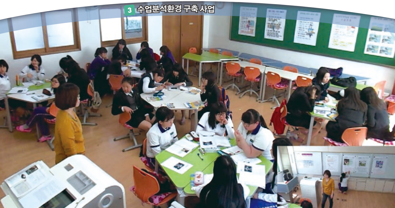
3 수업분석환경 구축 사업