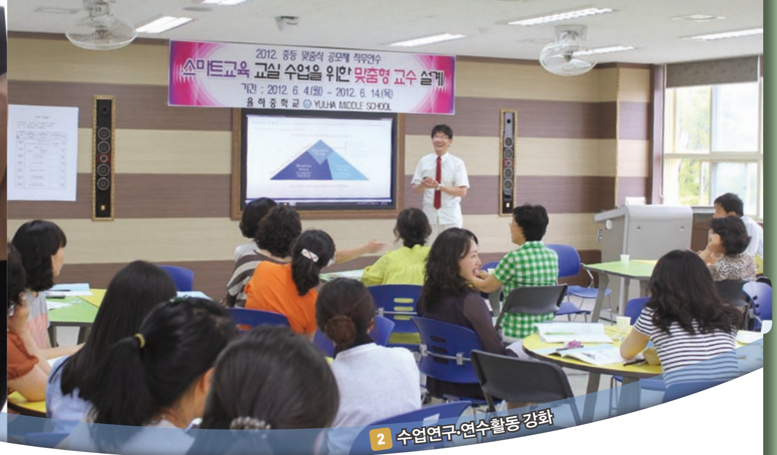
2 수업연구·연수활동 강화