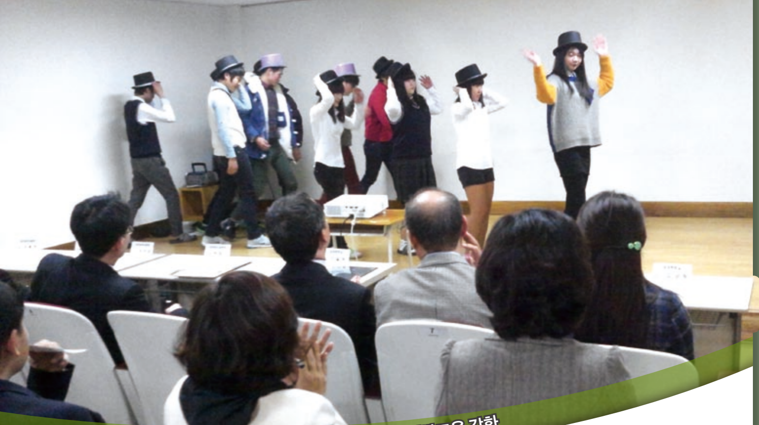
2 중도탈락 예방교육 강화