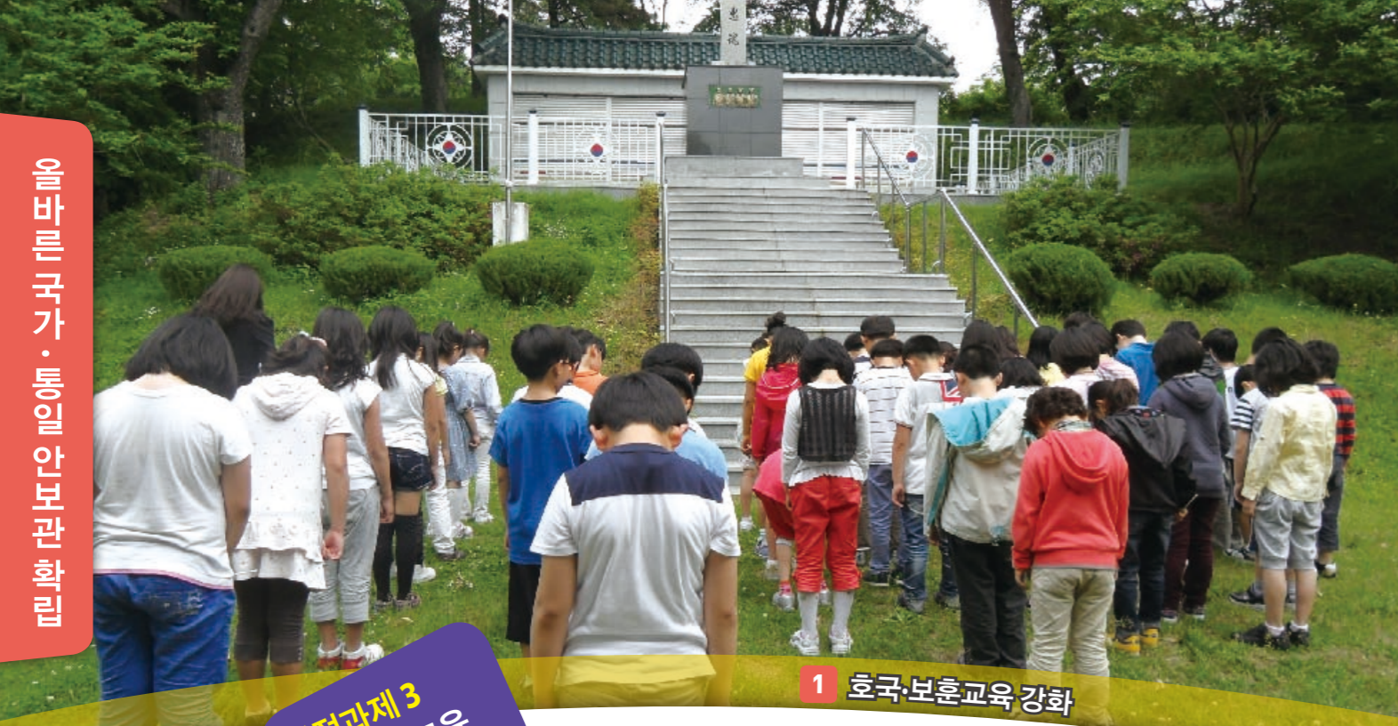
1 호국·보훈교육 강화