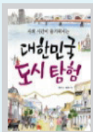
대한민국 도시탐험 한화주 / 아이세움

이 책은 재미있게 즐길 수 있는 놀이가 되기도 하지만, 우리 아이들에게 말하기 힘든 전쟁이나 굶주림에 대해 말할 수 있다는 사실까지 보여준다. 이를 통해 즐거운 상상에서 깊이 있는 사색으로 나아가게 하는 힘이 책에 있다는 사실을 알게된다.