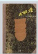
네 개의 그릇 이보나 헤미엘레프스카 / 논장