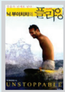
닉 부이치치의 플라잉 닉 부이치치 / 두란노

'불멸'이라는 뜻의 도시 '화양'에서 28일간 펼쳐지는, 인간과 살아 있는 모든 것들의 생존을 향한 갈망과 뜨거운 구원에 관한 이야기다. 절망과 분노 속에서도 끝까지 희망을 포기하지 않는 인간의 모습은 진한 감동을 안겨준다.