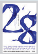
28 정유정 / 은행나무