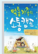
먹통가족의 소통캠프 김주희 / 길벗스쿨

대한민국의 눈부신 발전에 밀거름이 되고 독특한 문화와 역사를 자랑하는 도시 13곳의 탐험을 담았다. 이를 통해 사회 시간에서 배우는 지리나 문화, 역사, 경제가 도시와 어떤 관계가 있는지 이해할 수 있고, 비슷한 특징을 가진 다른 나라의 도시들과 비교해 보면서 앞으로 우리 도시는 어떻게 발전할 수 있을지도 생각해 볼 수 있다.