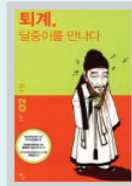
퇴계, 달중이를 만나다 김은미 외 / 탐

팔다리가 없어도 서핑에 도전하고, 요리를 하고, 드림을 연주하고, 타이핑도 치고, 그리고 결혼하고 아이를 낳았다. 그의 러브 스토리, 결혼, 아들의 이야기, 그가 고스란히 담겨 있는 가슴 따뜻한 책이다.