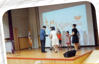
모범 이용자 시상