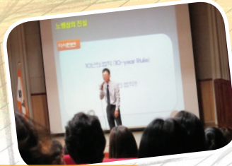
학부모교육 특강 -창의성, 그 잠재력의 실현을 위하여-