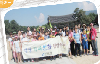
생생 가야 탐방 투어